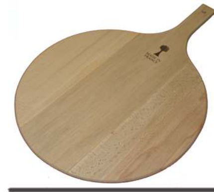
Rondeau / Take-out peel

Plateau de service à manche incorporé Dimension utile