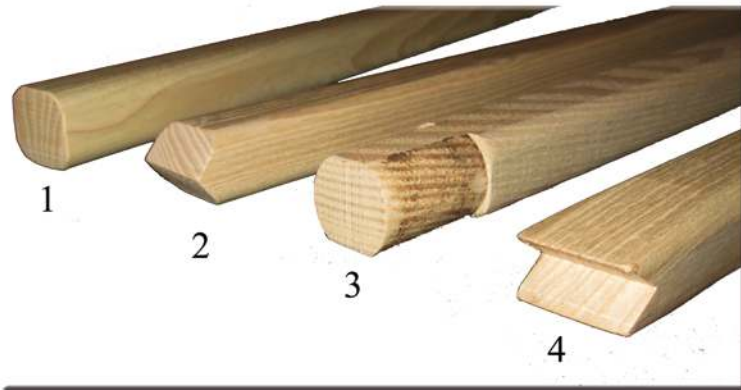
Manches / Handles