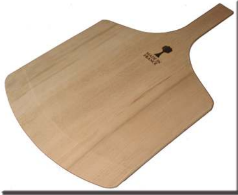
Plateau pizza/ Pizza Blade

Plateau de service à manche incorporé Dimension utile